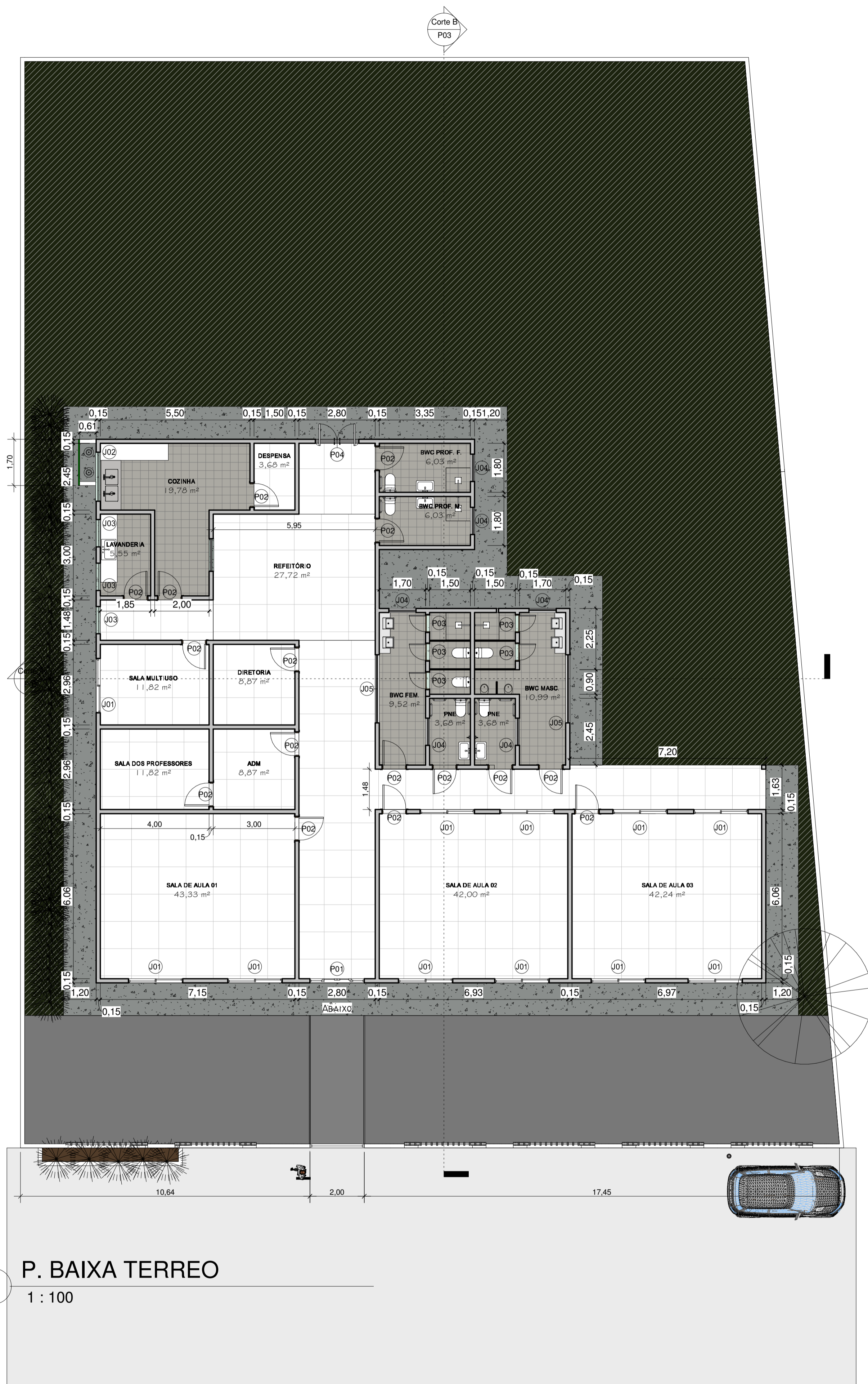
1 P. BAIXA TERREO 1 : 100