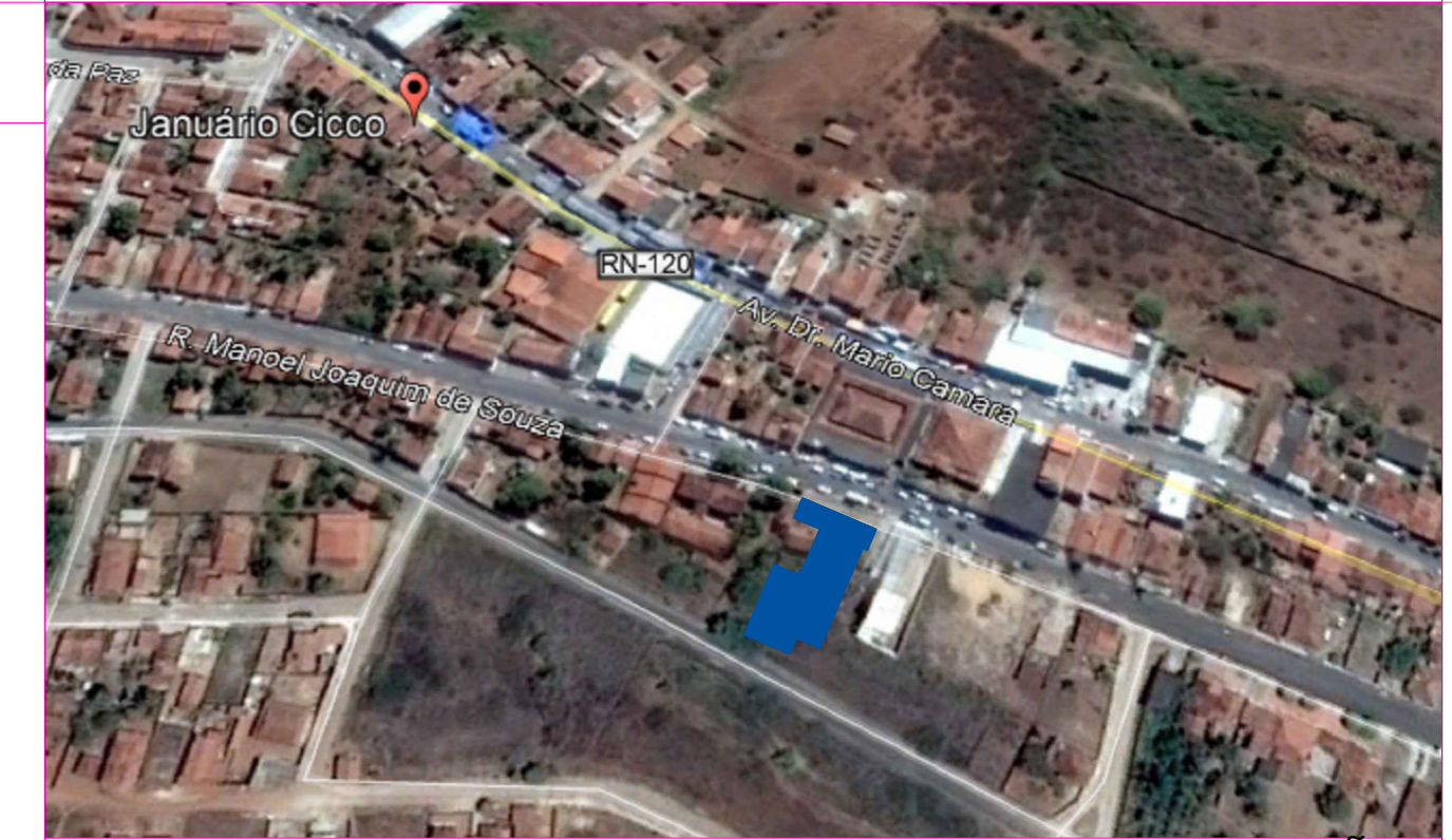
LOCALIZAÇÃO SEM ESCALA

AUTOR: _____ PROPRIETÁRIO: _____ EXECUÇÃO: _____